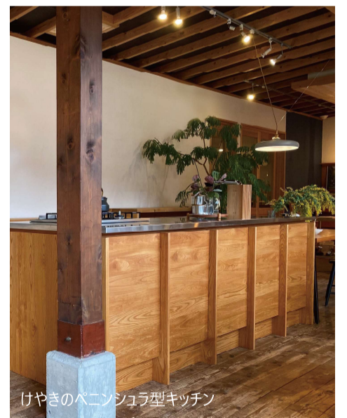
けやきのペニンシュラ型キッチン

究極にシンプルなかたちで、美しい木目が際立ちます。 こだわりは角の丸み。職人の手で生まれるその丸みが 空間の印象をやさしく変えます。