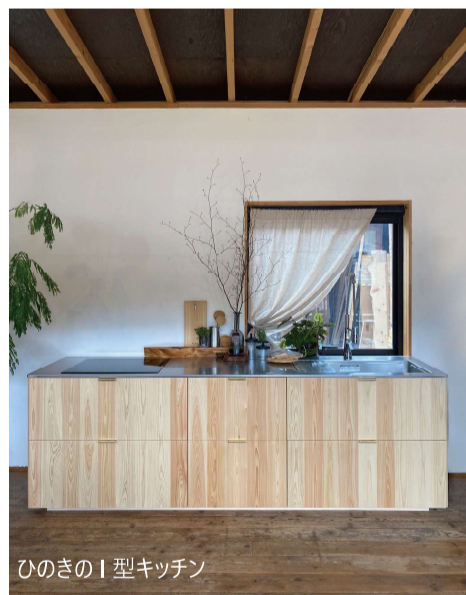
ひのきのI型キッチン

究極にシンプルなかたちで、美しい木目が際立ちます。 こだわりは角の丸み。職人の手で生まれるその丸みが 空間の印象をやさしく変えます。